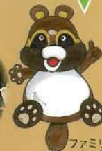
ファミリーパーク キャラクター 里ノ助