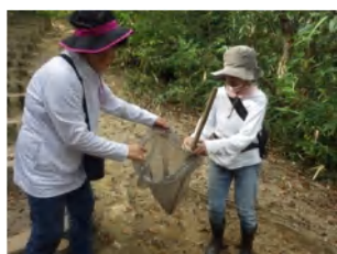
月いちウォーク前の下見とゴミ拾い

呉羽丘陵フットパス推進会議は、富山市ファミリーパーク、ウォーキング冒険塾、金屋ふるさとの会、花街道薬膳のまちを夢みる会と当倶楽部で構成。月いちウォークの定期開催の計画運営を担っている。