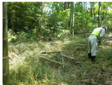
ファミリーパーク内の幼竹整備