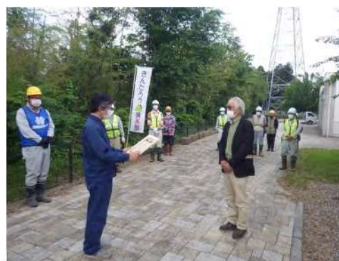
5月29日 国民の森林づくりに推進功労者に対する林野庁長官感謝状