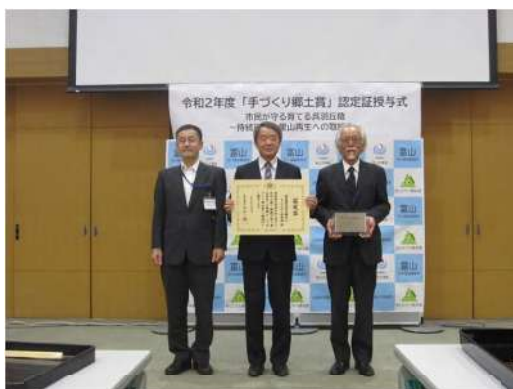
5月26日 手づくり郷土賞認定証授与式