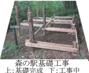
森の駅基礎工事 上:基礎完成 下:工事中

7年目を迎え、滑りやすくなり、ちょっとガタピシ、ユラユラし始めた「さとやまの木道」を、月一回定期補修と床磨きをして、安全に通れるようにしています。