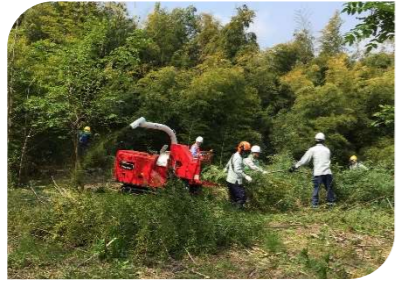
めひの野園裏竹林整備

活動拠点の呉羽丘陵では、きんたろうの森とわくわくの森で、月1回ずつ定期的に里山整備活動をしています。 その他にも、富山市内外の7ヶ所で地元の方たちと協働で、整備活動をしました。