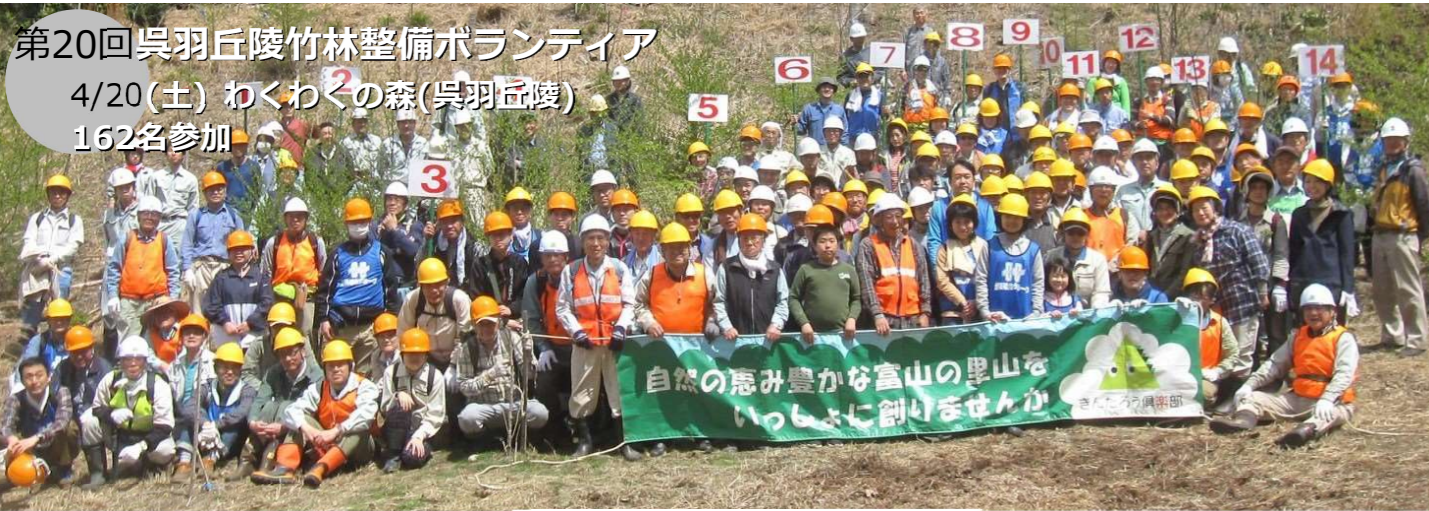
第20回呉羽丘陵竹林整備ボランティア 4/20(土) わくわくの森(呉羽丘陵) 162名参加