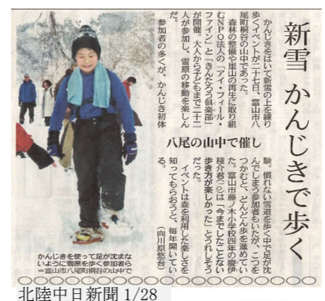
新雪かんじきで歩く

前日までの雪に恵まれ、外遊びには最適な天気！フワフワの雪の中で、カンジキを履いて歩きまわったり、新雪に飛び込んだり、と楽しみました。 その後は、雪で作ったテーブルを囲んで、チーズフォンデュで温まりました。