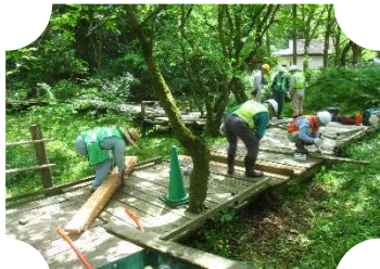
傷んだ路面板の張り替え

定期補修 4回 28名参加 3/13(日),4/10(水),5/22(水),6/19(水) 延伸基礎施工 6/24(月) 17名参加