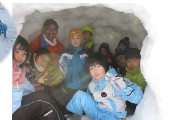
かまくらの中に全員が入って、入口を閉じ、暖かさ、明るさ、音の伝わりを体験しました。