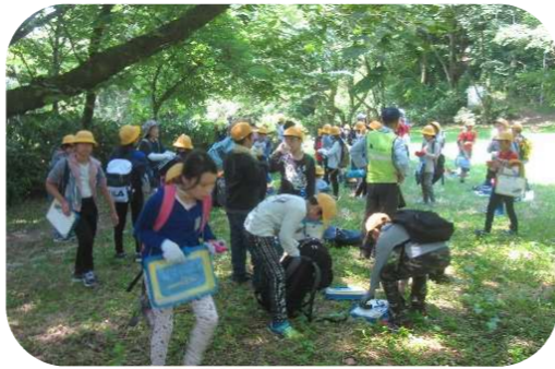
「こんな所に変な虫」

五福小5年生・自然観察 6/3(月) 呉羽丘陵フットパス 児童 67名参加 スタッフ 7名参加