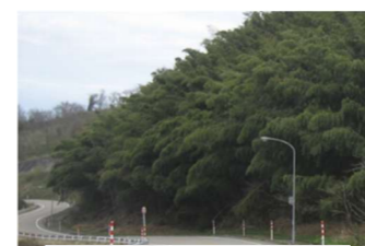
道路に覆いかぶさる竹

4/23(火) 東福沢下見 3名参加 5/15(水) 東福沢整備 7名参加 6/9(日) 文珠寺下見 4名参加 6/12(水) 文珠寺整備 5名参加