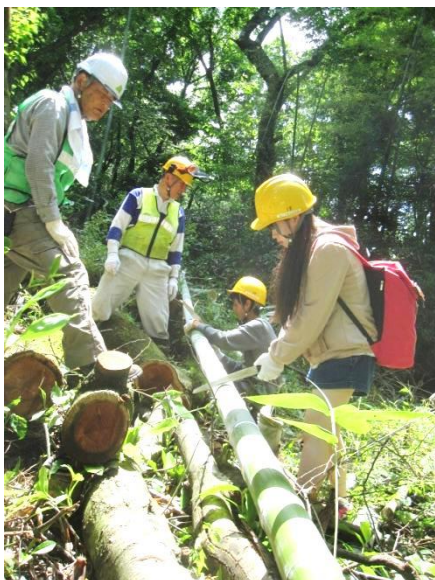
伐採竹の玉切り(星槎国際高校)

たくさん子ども達と、里山の整備をしたり、木の実や竹でクラフトをしたり、キャンプを楽しんだりしました。