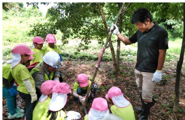
大きく育って混雑してきたドングリ林の間伐(やまむろ子ども園)