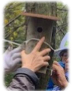
竹の巣箱の取付け

かんぽ生命保険様からのご寄付で、今年で4年目となる植樹活動ですが、今年は、紅葉が映えるモミジや萩など「秋よそおう森」をテーマに、植える樹木を選びました。活動の後は、しし鍋で一休み。シイタケのほだ木や竹での鳥の巣箱作り体験も行いました。子どもさんやご家族で参加される方も増えています。朝は小雨でしたが、まつりの最中は青空がのぞき、活動にはピッタリの日和でした。