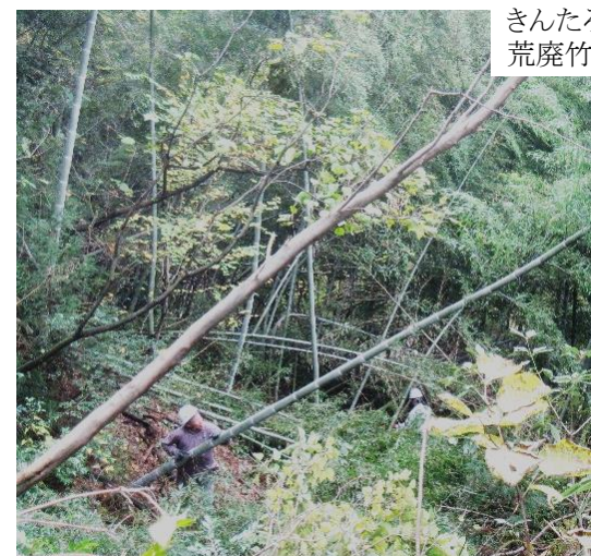
きんたろうの森 荒廃竹林整備

活動拠点の呉羽丘陵では、きんたろうの森、わくわくの森、金屋幻の滝で、月1回ずつ定期的に里山整備活動をしています。