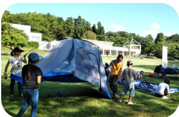
ファミリーパークでテント泊(呉羽丘陵たんけん隊)