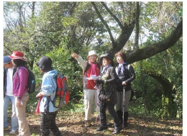
月いちウオークで解説する くれは里山 NAVI

各班には「くれは里山ナビゲータ」が付いて、解説・案内を担当しました。「くれは里山ナビゲータ」は、植生編3回、野鳥編1回、リスクマネジメント1回の研修を実施し、さらなるスキルアップに努めています。「くれは里山ナビゲータ」募集中です。