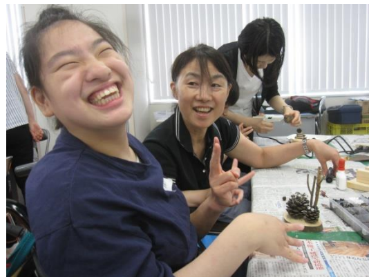
森の恵みで自由クラフト(総合支援学校)