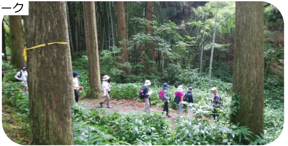
涼しい杉木立の森を歩く

5月から始まった呉羽丘陵フットパス月いちウオーク。暑い8月は涼しい杉木立の下を、12月は雨の中を落ち葉の絨毯を踏みしめて歩きました。10月からは5回完歩の方が出始め、健康の森賞（認定書と缶バッジ、マフラー）