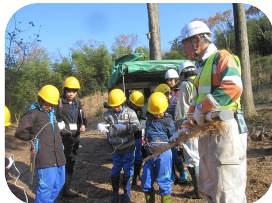
ヘルメットとノコギリを着けて準備OK(古沢小)