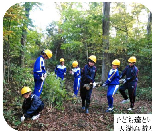
子ども達といっしょに 天湖森遊歩道整備