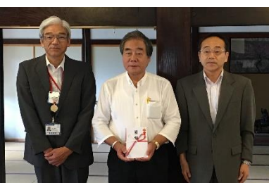
8月26日、くれは山荘で寄付金目録を頂きました。