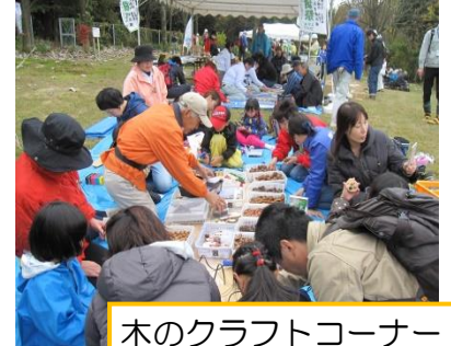
木のクラフトコーナー