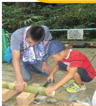
9/4 竹ポックリつくり

オレンジマート様からはご寄付をいただき、パーク来園者に無料で絵を描いてい ただけるロードペインティングも開催しました。