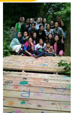
シンガポール 聖マーガレット学園