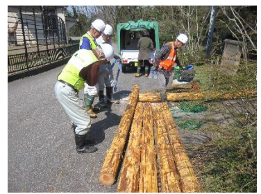
さとやまの木道基礎施工風景