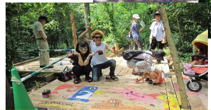
ロードペインティング (オレンジマート様の寄付で開催)